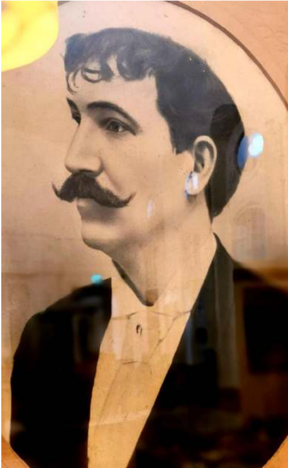
Huszár Károly arcképe