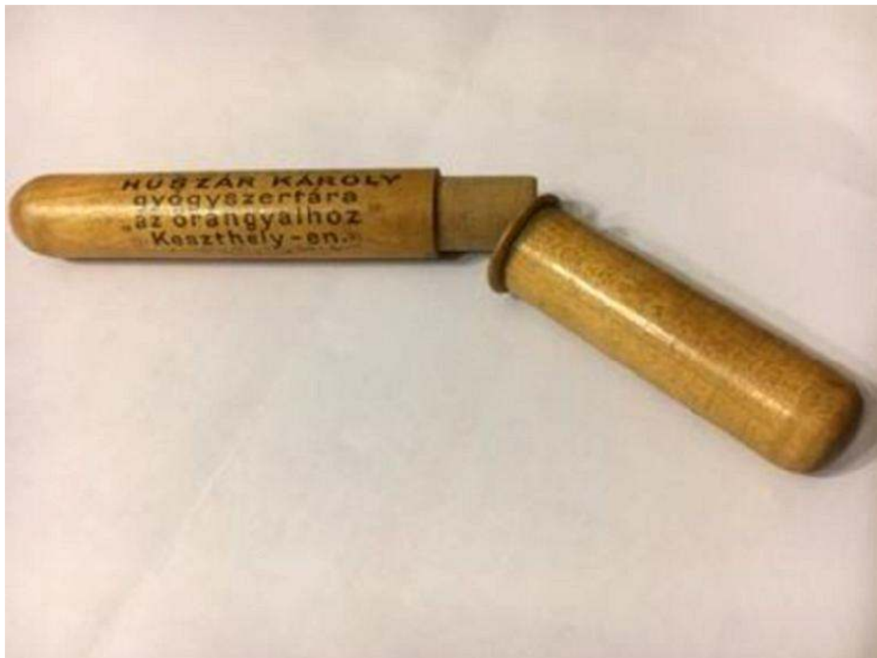
Lázmérő tok a Huszár-patikából

szereetre méltó modora s a szegényekkel tanúsított jó szíve egy csapásra virágzó üzletté tették” a patikát. A gyógytár az Őrangyal nevet kapta. A Keszthelyi Hírlap a megnyitást követően hosszabb elbeszélés formájában tudósít az új, a mai Kossuth (Sétáló) utca és a Fő tér találkozásánál lévő, egykori szállásház (ma Városháza) földszinti sarokrészében helyet kapó intézményről.