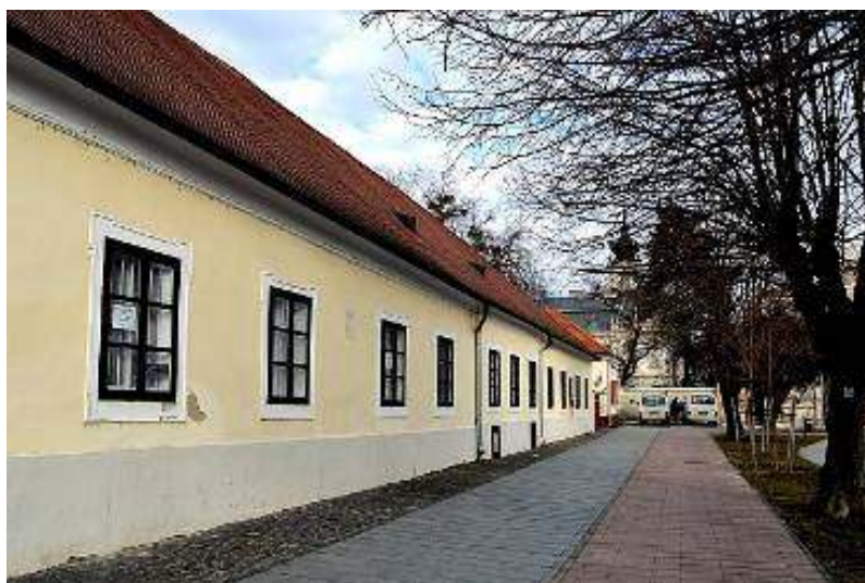
Az inézői (curiális) ház utcai homlokzata ma