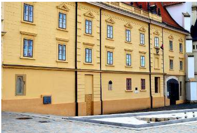
Az egykori ferences rendház mai képe, vélhetően az egykori patika befalazott bejárati ajtajával

Keszthely első, Zala megye második patikáját Festetics Kristóf alapította, valószínűleg a XVIII. század közepén. 5 Erre utal az az 1780-ból származó jelentés, amelyben a ferencesek gárdiánja „ az emlékezésre méltó nagyságos Festetics Kristóf Úr által alapított keszthelyi gyógyszerár ”-ról ír. 6 Üzemeltetésével a ferences barátokat bízták meg, ám valószínű, hogy 1748-1789 között a tulajdonjog is őket illette. 7 Nem véletlenül esett a választás a ferencesekre azon túl is, hogy Keszthelyen már volt rendházuk. Ugyanis a nyugati keresztény szerzetesrendek majdnem mindegyike – a bencések, domonkosok, ciszterciek, a lovagrendek, később a kolduló ferencesek – tartott fenn patikát, foglalkozott a betegápolás „klasszikus” formájával. 8