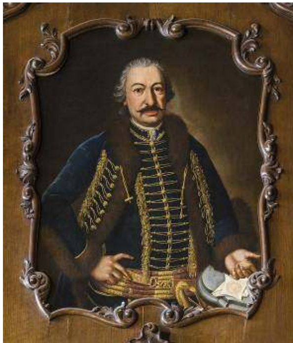
Festetics Kristóf képe a keszthelyi kastély családi arcképcsarnokában

A patika kifejezés először a Bécsi Kódexben (1450 körül) jelent meg és az apotheca szóból származtatják kialakulását - írja Dr. Gyarmati Györgyné a rendeki patika történetét feldolgozó rövid, összegző munkájában. A latin patika terminus technikus minden bizonnyal az ógörög apotheke (~raktár, lerakat) szó átvétele. II. Frigyes 1241-ben rendezte az orvosi és gyógyszerészi gyakorlatot, amikor is kötelezően szétválasztotta e két szakmát. Ez volt a gyógyszerészi (és orvosi) önállósulás kezdete. Mária Terézia 1743-ban rendelkezett a vármegyéenként egy patika alapításáról, aminek eredményeképpen 1747-ben negyvennyolc, 1 a század végén már százkilencvenhárom vármegyei, városi, szerzetesi patika működött. 2 Zala vármegye első gyógyszertárát Nagykanizsán, a ladislaita tartományhoz 3 tartozó nagykanizsai ferences szerzetesek alapították és 1714-ben már bizonyosan üzemelt. 4