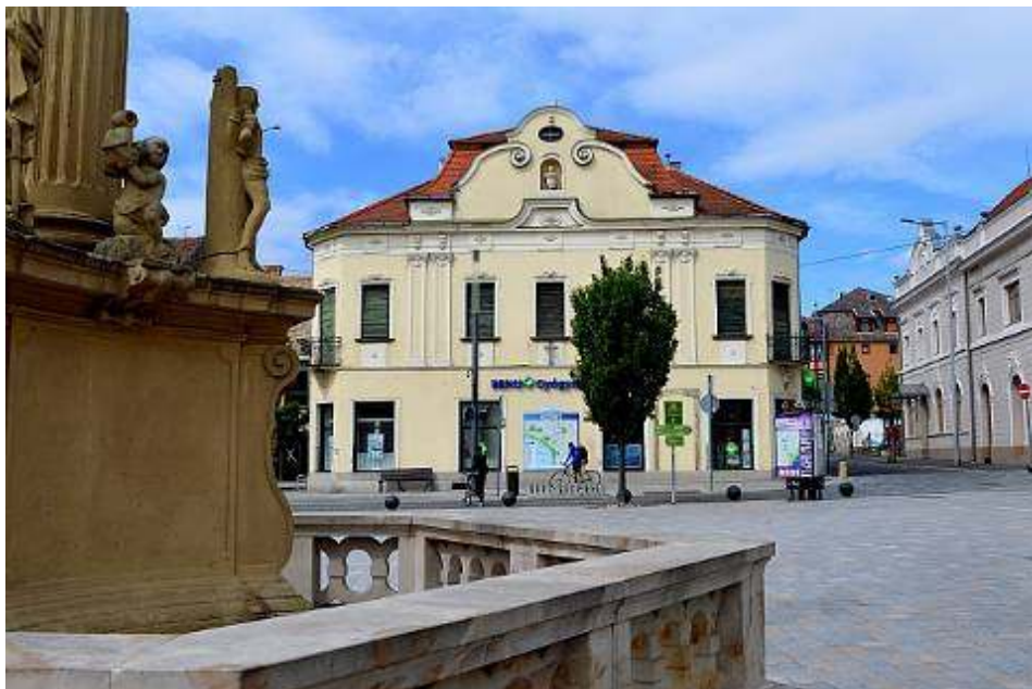
Az Órangyal Gyógyszertár épületének mai képe