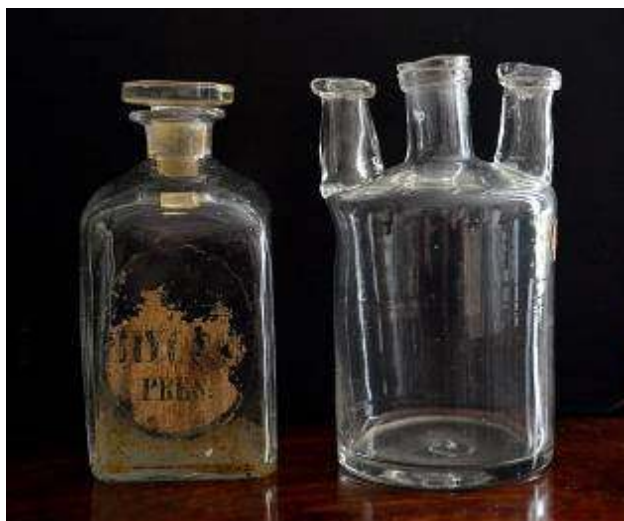
Régi (megmentett) patikaedények