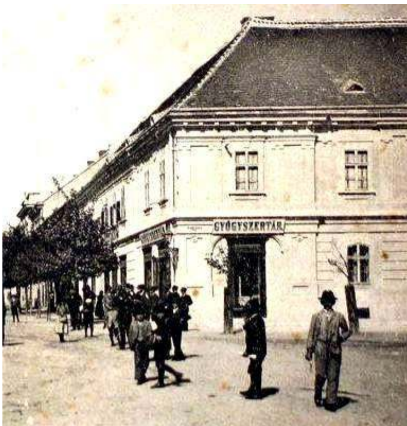
A Huszár patika

gimnázium részére egy óriáskígyót ( Boa constrictor ), amit az iskola szertárában helyeztek el. Ugyancsak nekilátott az óriáskígyó csontvázának kikészítéséhez is. Ám nem kizárólag a gimnáziumnak, de a gazdasági tanintézetnek (Georgikon utódja) is készített ki állatokat, mintegy száz darabot. 40