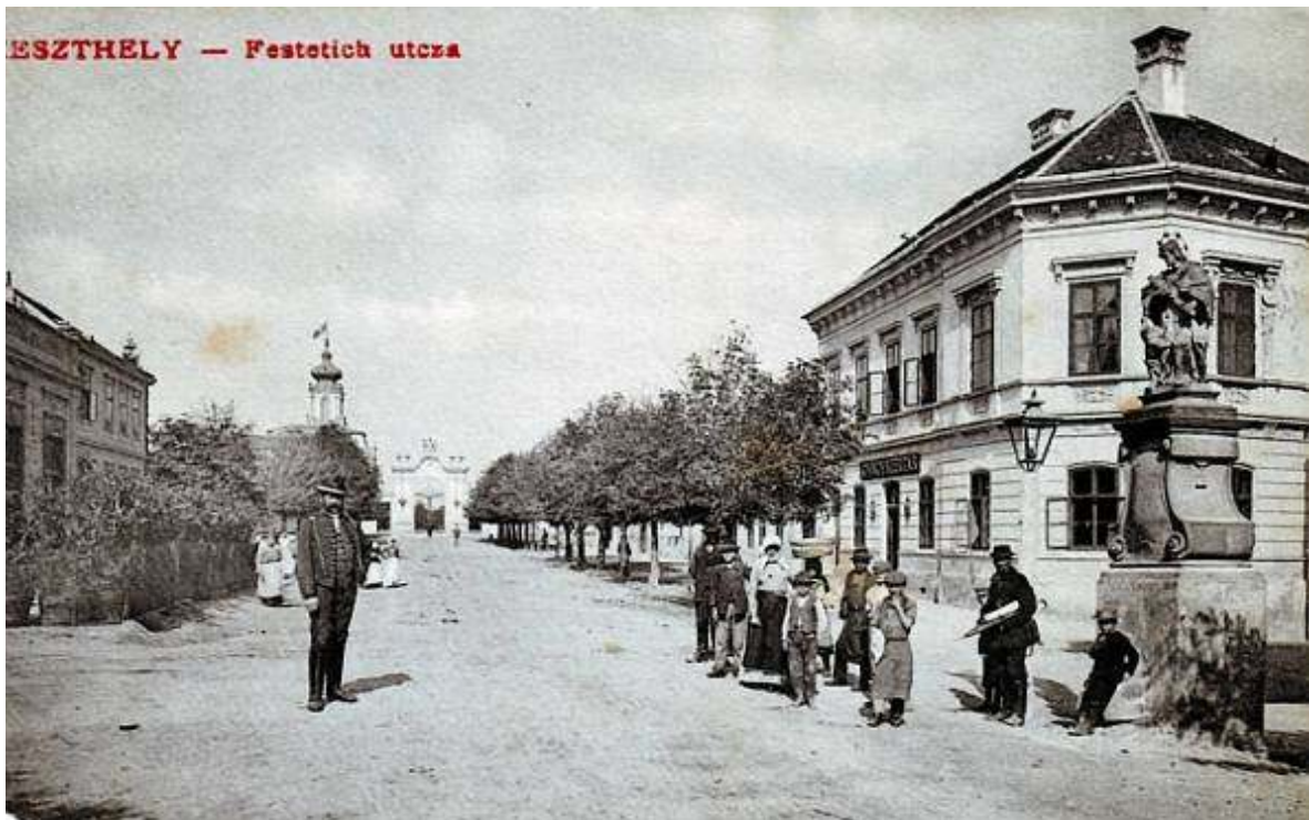
Jobbra a Két Oroszlán Gyógyszertár (1909)

A gyógyszerészek jövedelméről természetesen a Festetics uradalom gondoskodott. A rendszeres fizetés mellett a patika tiszta jövedelmének bizonyos százaléka is megillette őket.