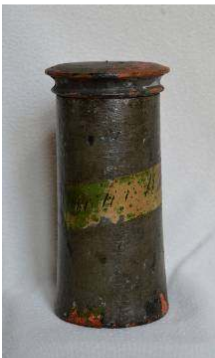
Az egyik, vélhetően a patika őskorából származó, megmentett, fa patikaedény

A patika berendezéseiből, felszereléséből nem maradt fenn, hitelt érdemlően, jóformán semmi. A gyógyszertár 1950-es évek végén történt átalakítása során – sok mindennel együtt – kidobtak egy körülbelül fél méter magas, míves, szép díszítésű, barokk bronz mozsarat és több régi fa patikaedényt, melyek közül az egyik, feltehetően, a keszthelyi patika „őskorából” származhatott. (Jelen sorok írója a patikaedényt a kidobásra szánt törmelékek közül kiemelte.) 15