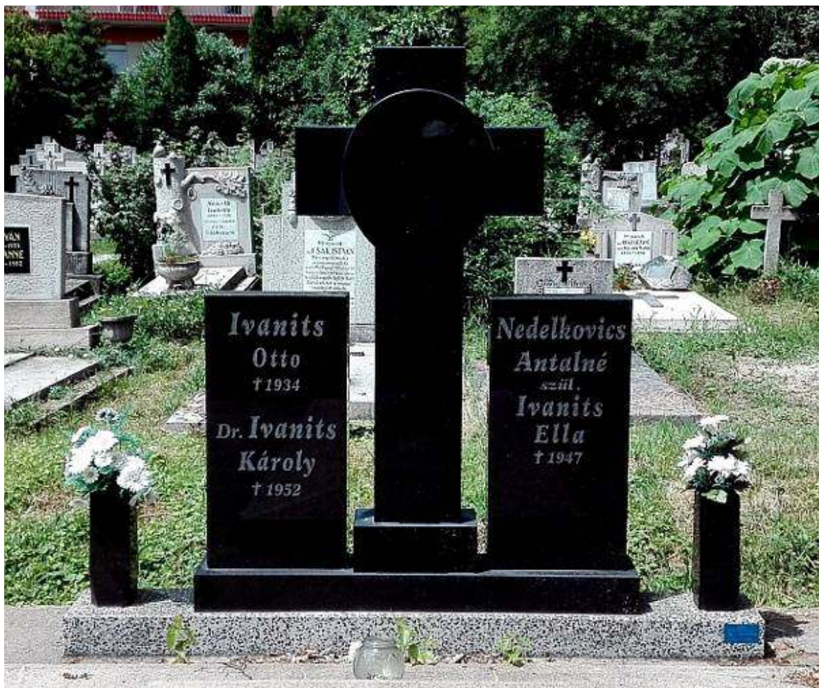
Az Ivanits család sírja a keszthelyi Szent Miklós temetőben