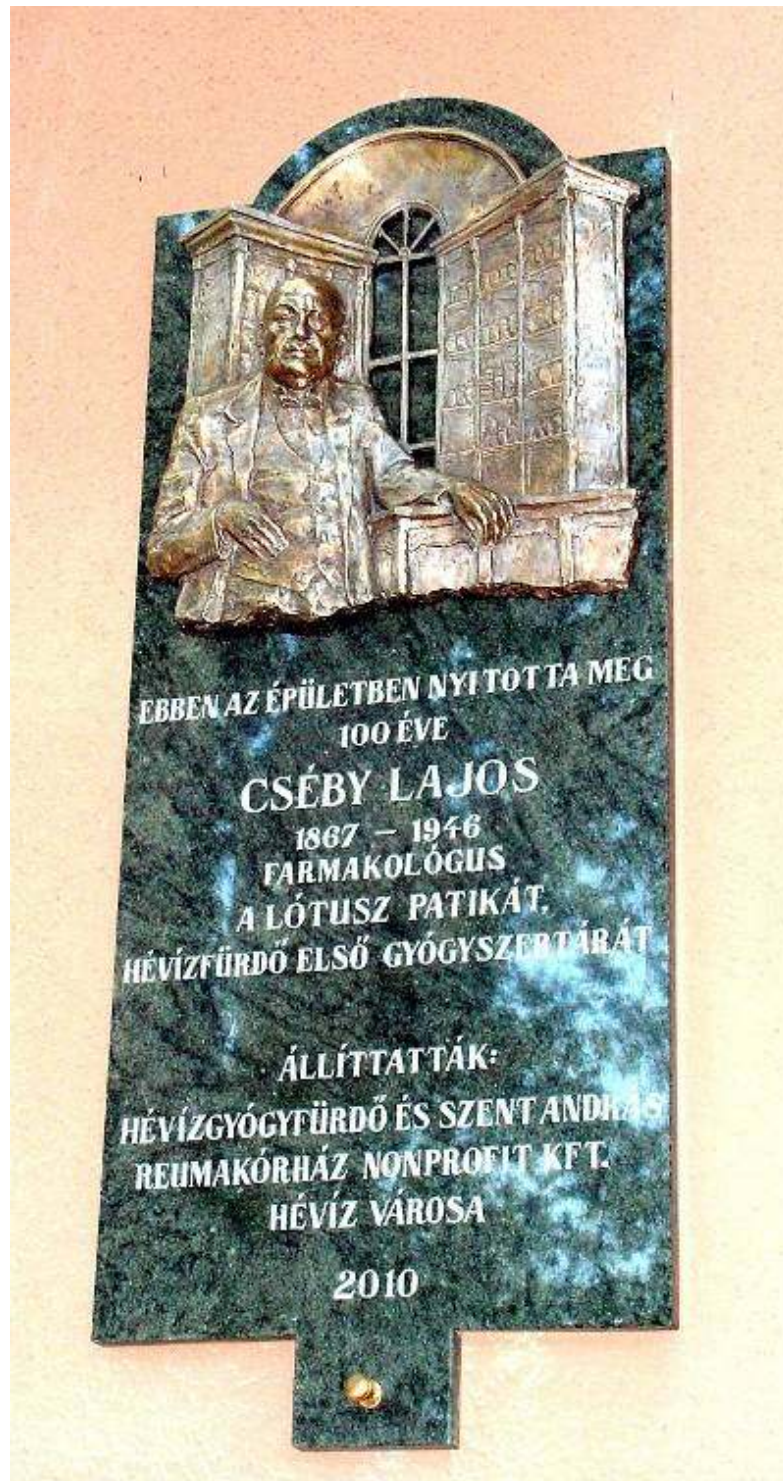
A hévízi Szent András Reumakórház D. épületének falán elhelyezett emléktábla