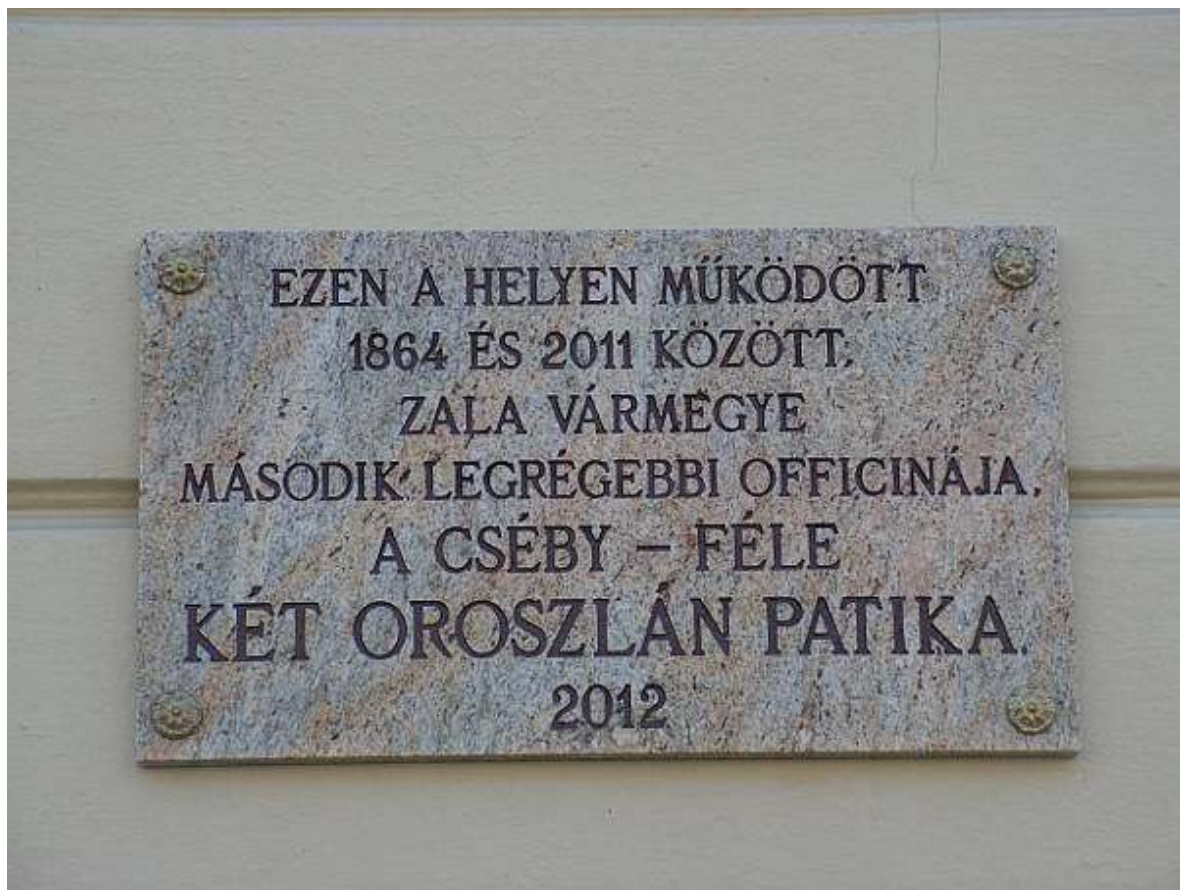
A volt Két Oroszlán Gyógyszertár falán 2002-ben elhelyezett emléktábla (a Keszthelyi Köztéri Alkotásaiért Alapítvány anyagi segítségével)

1845-ben felmerült az igénye annak, hogy második patikát nyissanak Keszthelyen. Ezt Némethy Pál balatonfüredi gyógyszerész vetette fel, kérvényét el is küldte a vármegye főorvosának. Úgy tűnt, hogy a megyegyűlés pozitív határozatot hozott, a Helytartótanács mégis elutasította a kérelmet. „Ugyanis Keszthely földesura, a Festetics család Mesterházy János uradalmi ügyésszel készítettett nyilatkozatában (mintegy 5 folio oldal) a gyógyszertár felállítását nem tartotta indokoltnak.” 33